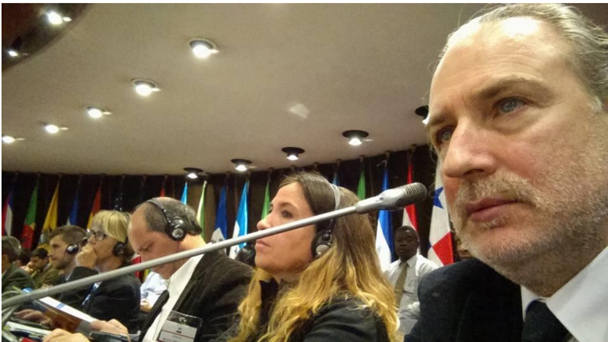
Septiembre de 2015, en el edificio de Naciones Unidas de Santiago de Chile, dentro del Foro Latinoamericano del Carbono, manifestando la dificultad de Argentina para obtener financiamiento climático.