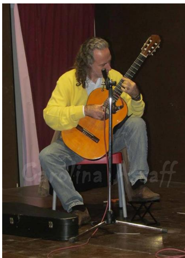
30 de Abril de 2014, Tafí Viejo, Tucumán, dando un concierto en la inauguración de la sede de la Delegación de los Derechos Humanos de Tafí Viejo.