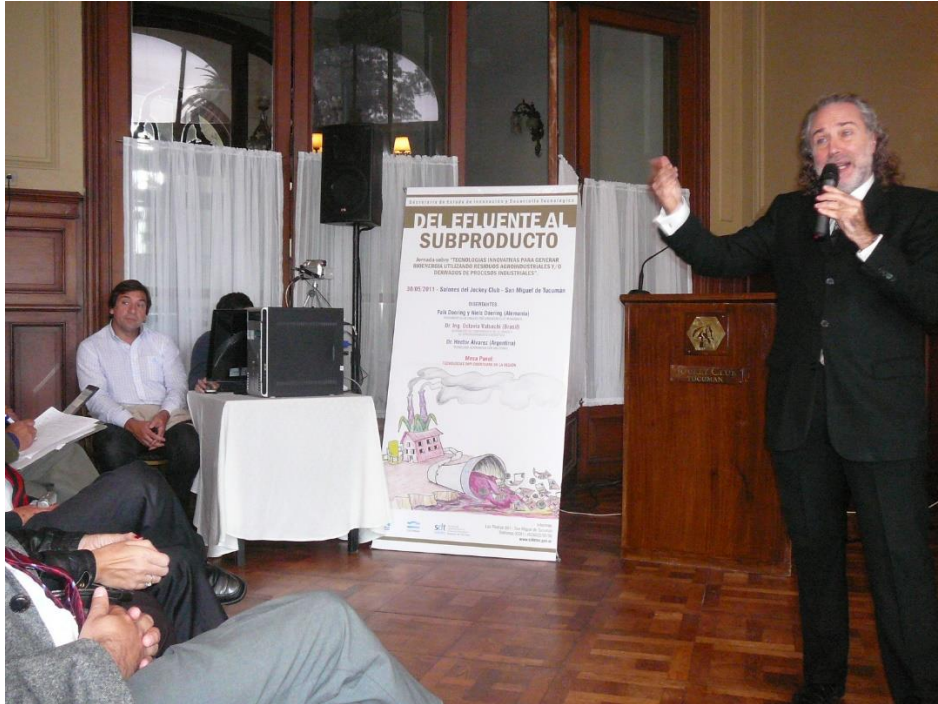
30 de Mayo de 2011, San Miguel de Tucumán, Disertando sobre Estructuración Financiera en el tratamiento de Vinazas. Tucumán