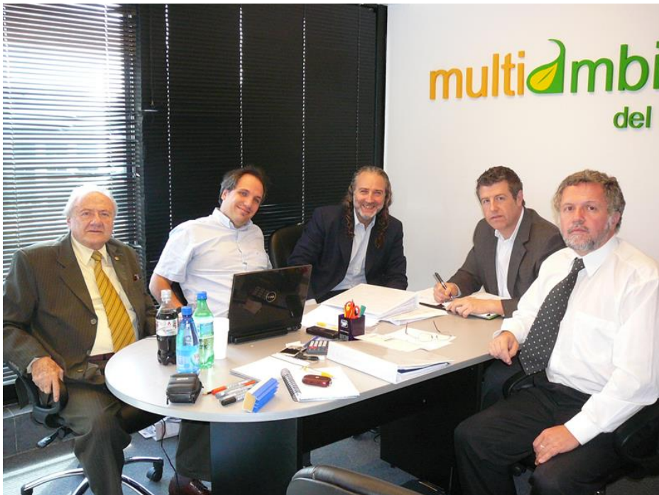
31 de Marzo de 2009, con el grupo italiano Multiambiente del Plata, y el grupo inversor norteamericano traído por nosotros, Ameresco, para el financiamiento de una instalación de Extracción de Biogás de relleno sanitario, en CEAMSE.