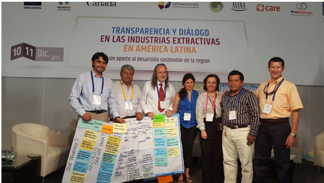
11 de Diciembre de 2015, Lima, Perú. Edificio del PNUD. Como parte del grupo de disertantes en el Congreso sobre transparencia y diálogo en las industrias extractivas.