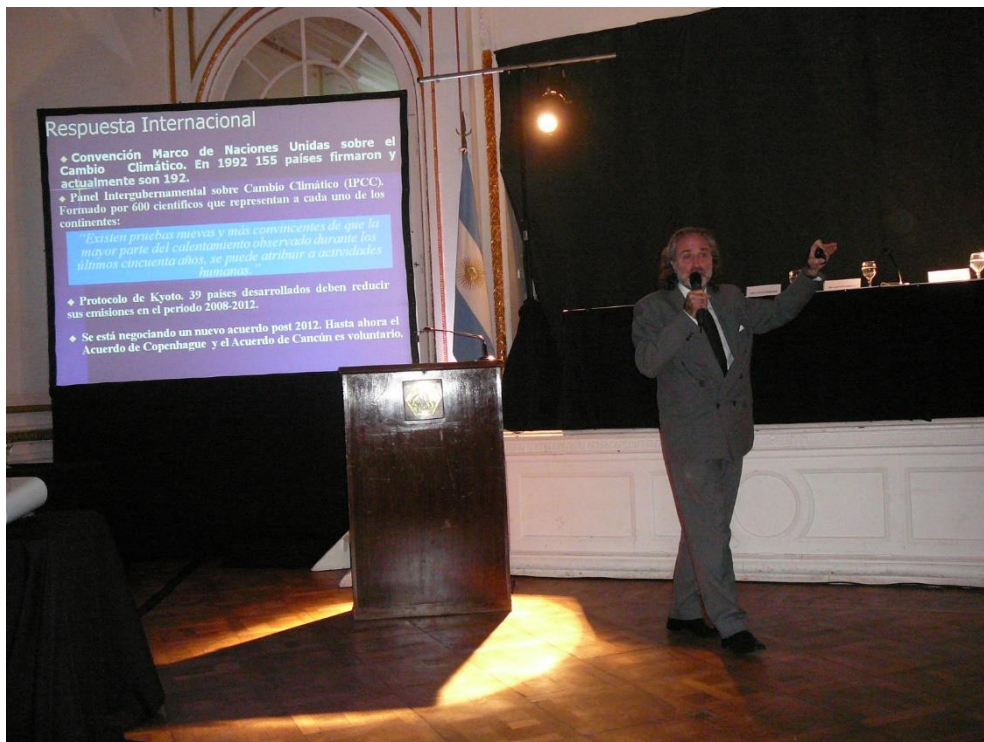
19 de Mayo de 2011 – Financiación con Bonos de Carbono de un Reactor Anaeróbico para producción de gas en efluentes de la citrícola Citromax.