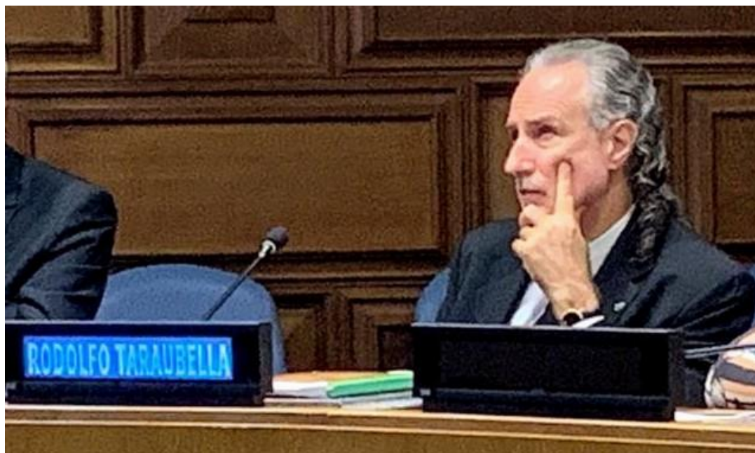
15 de Julio del 2019, Conferencista del Foro Político de Alto Nivel en Desarrollo Sostenible de las Naciones Unidas, Nueva York, EEUU