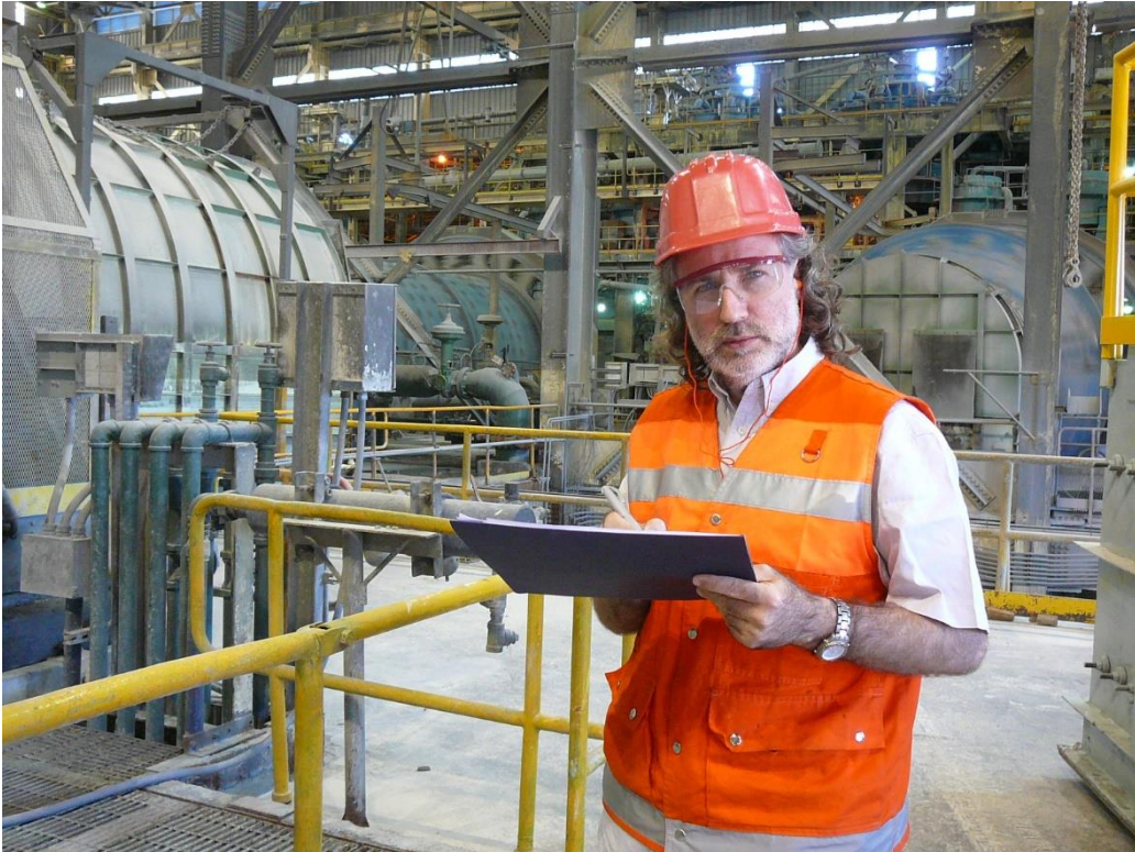
21 de Marzo de 2011, midiendo la huella de Carbono en Minera Alumbreira, Catamarca