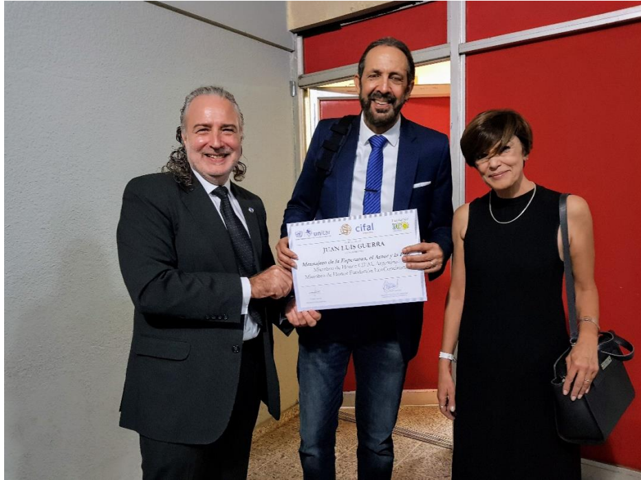
Abril de 2018, Junto al Cantante Juan Luis Guerra, en República Dominicana, al momento de nombrarlo Miembro de Honor y Embajador de la Esperanza y la Paz de nuestra agencia.