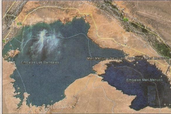
Las urbanizaciones están previstas en el istmo que separa los lagos Mari Menuco y Los Barreales.

Tres horas más tarde, ese mismo día, se realizará la otra audiencia pública de la caja previsional de la municipalidad de Neuquén que prevé construir el