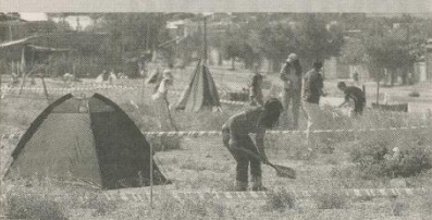
FAMILIAS. ALREDEDOR DE 200 PERSONAS SIGUIEN EN LOS TERRENOS FISCALES.

➔ Se apostaron en el barrio durante el fin de semana. La Justicia identificó a 50 familias y dijo que tienen 72 horas para dejar el lugar.