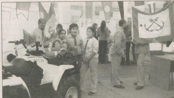
CIENTOS DE VISITANTES SE CONGREGARON EN UNA DE LAS GLOBAS INSTALADAS EN EL PARQUE CENTRAL CAPITALINO.

Neuquén > Con gran éxito y una importante concurrencia, se está realizando en esta capital el Segundo Festival Mundial de la Tierra, que tiene como objetivo primordial el cuidado del medio