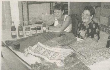
LAS EMPRENDEDORAS DE LA FINCA DOÑA ROSA YA TIENEN PRODUCTOS A LA VENTA.

La primera instancia consistió en recibir las inquietudes de grupos conformados por entre tres y cinco personas, de los cuales se evaluó la posibilidad de susten-