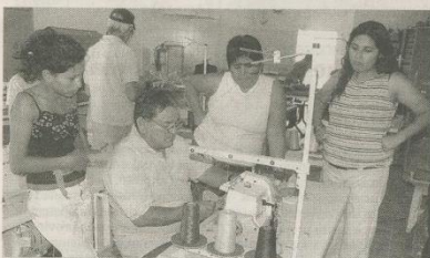
LA GENTE QUE SE DEDICARÁ AL RUBRO TEXTIL PRACICÓ CON LAS NUEVAS MÁQUINAS.

Neuquén > Ayer por la mañana, telefónica restableció el servicio en las zonas afectadas durante parte del día miércoles y todo el jueves. Así, los comercios retomaron su calma. "Hoy -por ayer- nos encontramos con el teléfono funcionando. Llamé a la empresa para averiguar el motivo del corte y no me supieron decir producto de qué fue", expresó aliviado y con buen humor un comerciante del alto neuquino.