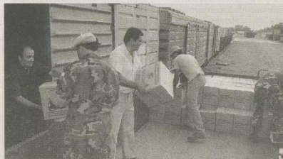
DONACIÓN. MÁS DE 5.000 KILOS DE PAPA DESHIDRATADA LLEGÓ DESDE ITALIA.