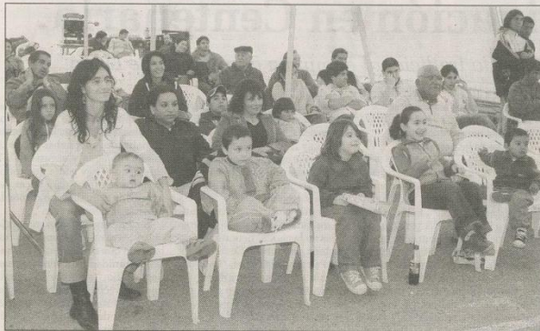
DECENAS DE NIÑOS DISFRUTARON DE LOS TITERES. CON MUCHA ATENCIÓN, OBSERVARON LA OBRA.

de interés por la Secretaría de Estado de Cultura de la provincia.