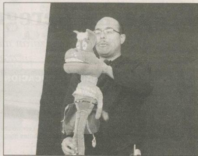
A TRAVÉS DE LOS TITERES, EL ARTISTA SE GANÓ LA ATENCIÓN DE LOS MÁS PEQUEÑOS.

El acceso a todas las actividades que se brindan en las globos instaladas en el Parque Central es libre y gratuito. Sólo se pide como colaboración el aporte de un alimento no perecedero, que