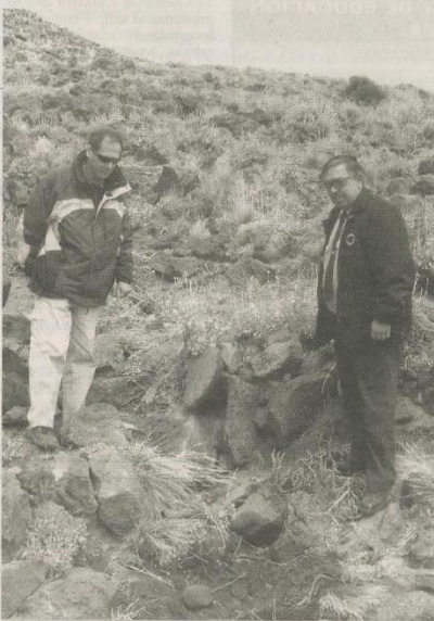
AUTORIDADES, EN PLENO RECORRIDO EN EL ÁREA PROTEGIDA AUCA MAHUIDA.

El Área Natural Protegida de Auca Mahuida, en estos momentos, tiene la reserva más importante de guanacos de la provincia del Neuquén.